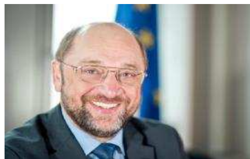
Martin Schulz Presidente del Parlamento europeo