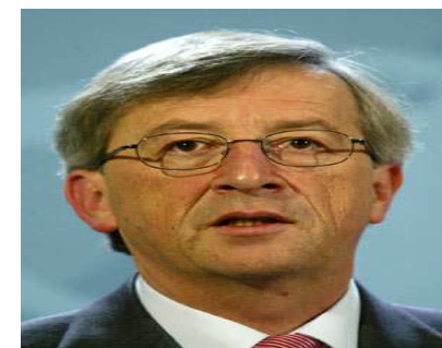
Jean-Claude Juncker Presidente della Commissione europea