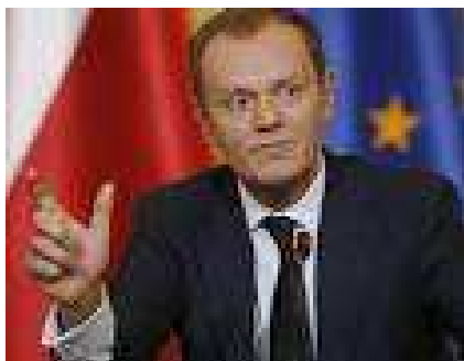
Donald TUSK Presidente del Consiglio europeo